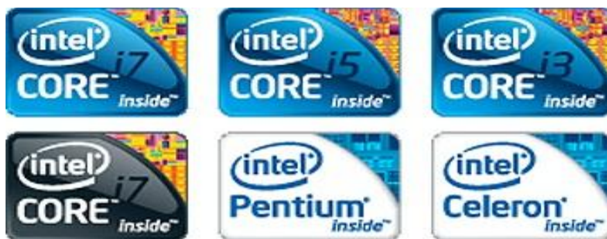
3.13.1 فرق سیستم های چند هسته ای

فرق core i7 با core i5 و core i3 و core 2 due :