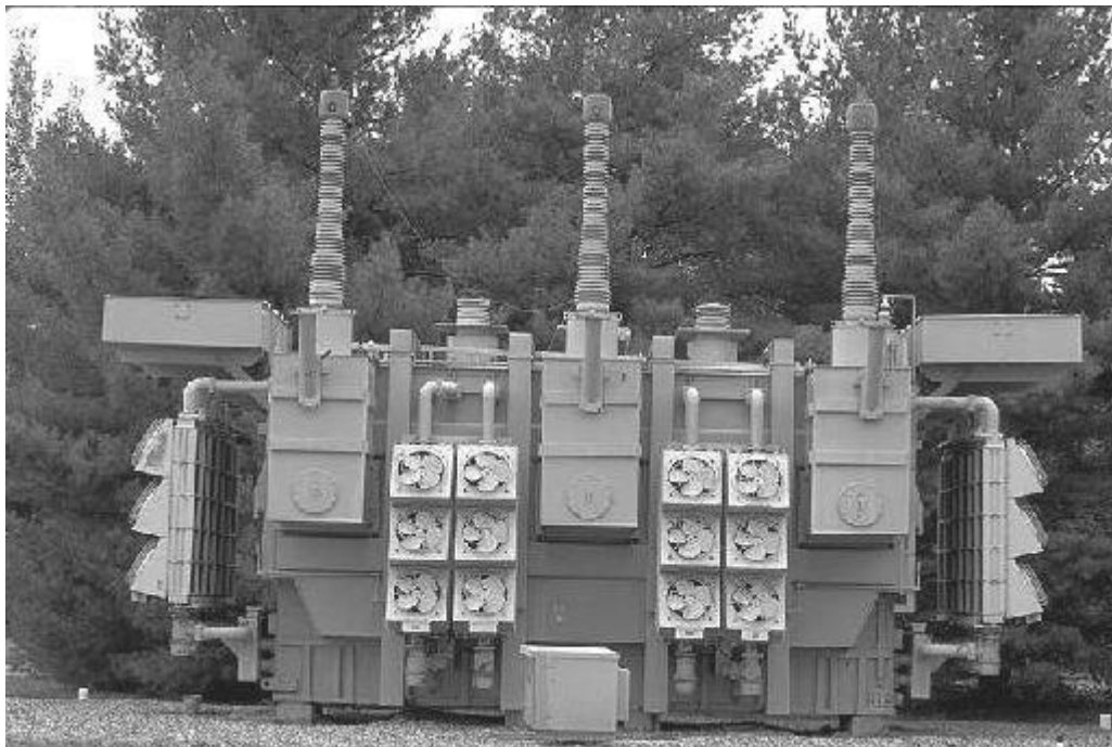
( نمایی از یک ترانس )