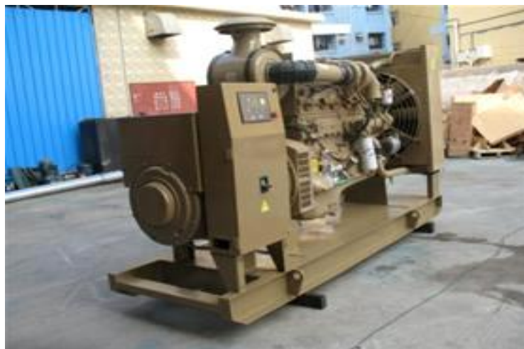
( دیزل ژنراتور )

عمل تعویض مصرف داخلی بوسیله یک کلید دو حالتی بطور اتوماتیک یا دستی انجام می گردد. در موقعی که ترانس ها از مدار خارج می گردند ، باید سریعاً دیزل ژنراتور وارد مدار گردد و برای آنکه از دیزل با توان کمتری جهت صرفه اقتصادی استفاده گردد قسمتهای غیر ضروری را از سرویس خارج می کنیم .