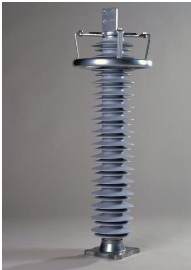
( برقگیر )