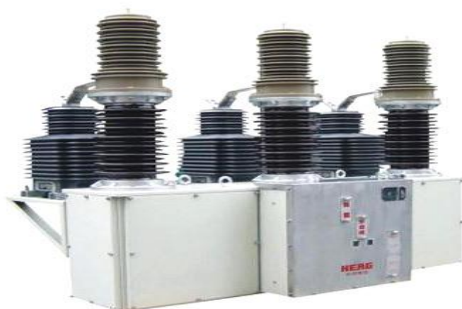
( یک نمونه بریکر خلاء )

که این عمل توسط رله های مختلف انجام می شود مانند رله بوخهلس ، رله فشار روغن . همچنین رله های دیگری در پست وجود دارند که برای عملکرد بریکرها می باشند که برای تمامی این رله ها از منبع DC استفاده می شود.