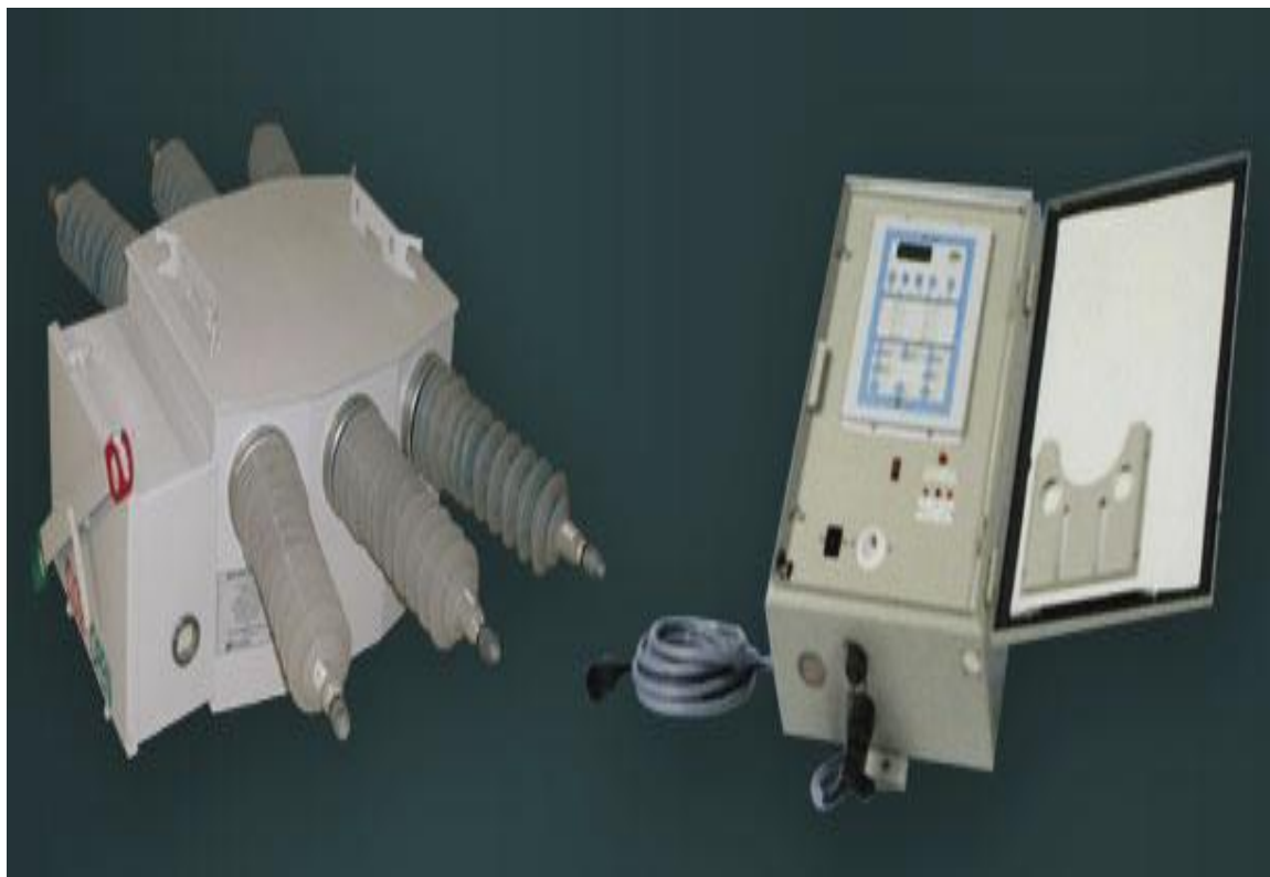
( سکسیونر با قابلیت نصب در فضای باز )