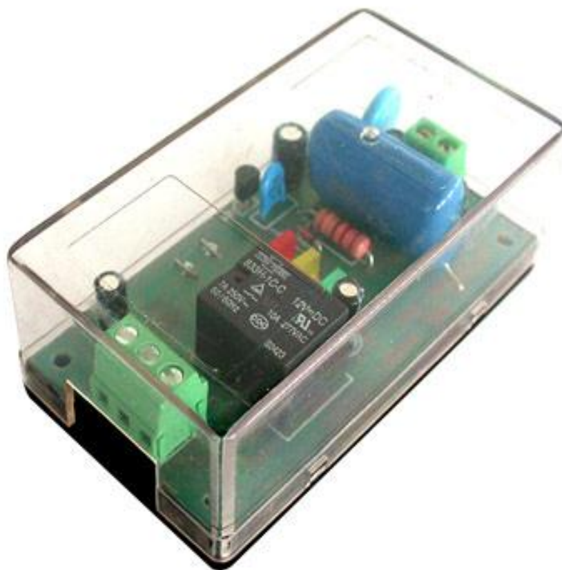
( رله ی آندر ولتاژ Under Voltage Relay )