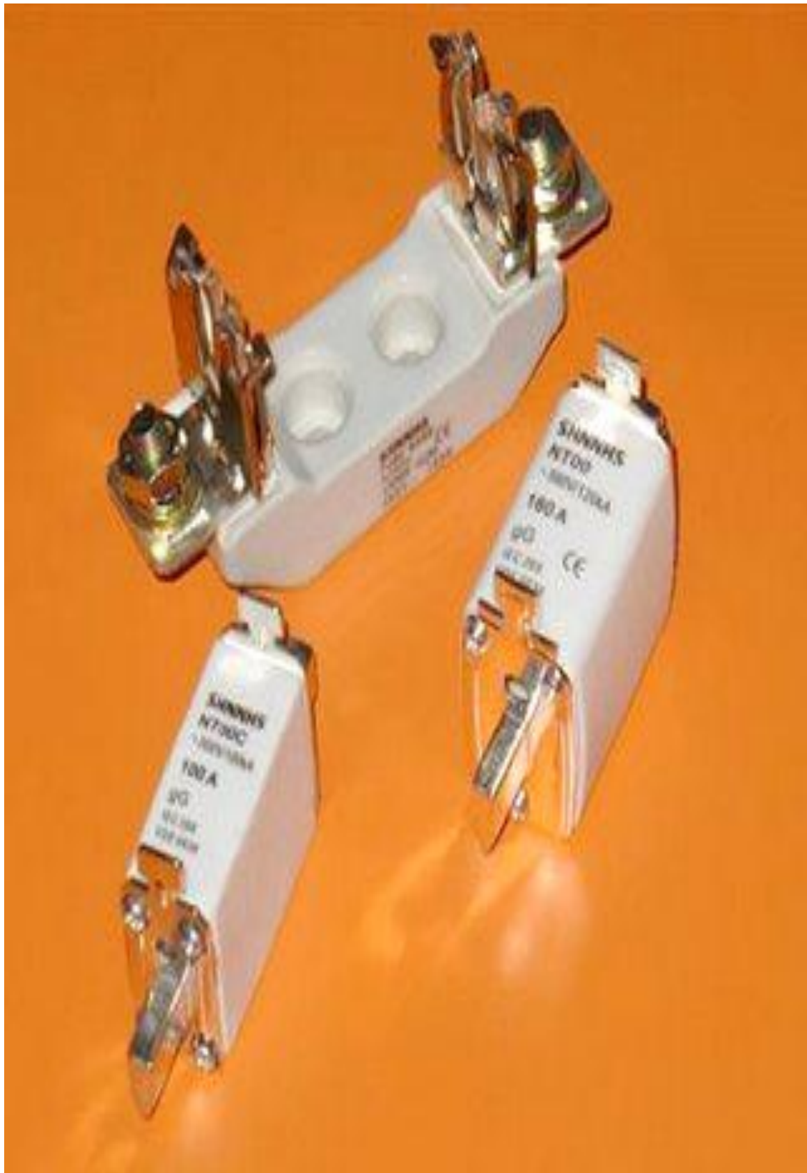
( فيوز )